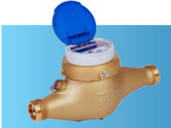
MTKcoder® MP mit Induktiv-Schnittstelle